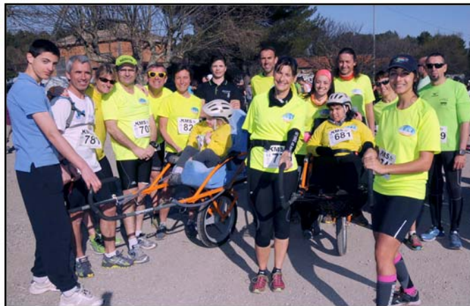
Les joëlettes de l'association Les Dunes d'Espoir (2015)