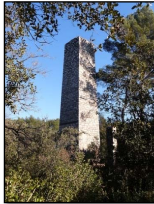
La cheminée du puits Bonaventure

Traditionnellement et grâce au partenariat établi avec la mairie de Gréasque et le Musée de la Mine , le départ des courses est donné de l'esplanade du musée, au pied du puits Hely d'Oissel à Gréasque. Les coureurs traversent alors le quartier des anciennes cités minières, puis le centre du village. Ensuite, l'essentiel du parcours se déroule sur les sentiers de la forêt des Euves attenant au village, en sillonnant plusieurs sites pittoresques (le plan d'eau du Tombereau, l'ancienne voie romaine, les ruines du village minier du Thubet et des puits Prosper et Bonaventure...). Enfin, l'arrivée est jugée devant la Maison des Sportifs du stade de Gréasque.